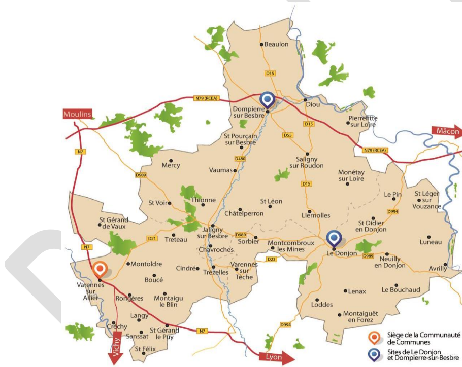
Figure 1 - Présentation de la CC Entr'Allier Besbre et Loire

Créée le 1 er janvier 2017 suite à la fusion de 3 Communautés de communes (Le Donjon Val Libre, Val de Besbre - Sologne Bourbonnaise et Varennes - Forterre), la Communauté de communes Entr'Allier Besbre et Loire est située à l'Est du département de l'Allier. Le territoire rassemble 44 communes pour 25 357 habitants, avec une superficie de plus de 1089 km 2 .